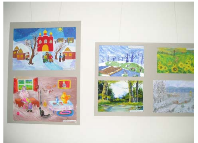
Disegni dei bambini durante Il loro ricovero