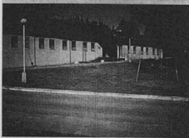
Department of rehabilitation in Ostroshitski Gorodok

So far the association has set up a kindergarten for children with cancer, throughout the year it supplies children's oncological clinics with expensive medication and equipment and organizes recuperative