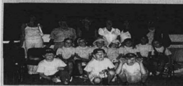
Children are having rest at our partners'.

We hope you understand that problems with children who have various forms of cancer will not disappear either tomorrow, or in the near future. The charity "Children in Trouble" ask you for help and hopes for your understanding and support