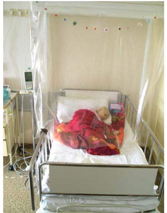
Nei reparti, con i bambini ricoverati